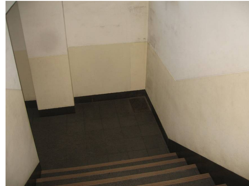
手摺り設置前（踊り場より上側）